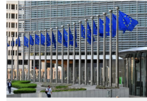
The entrance to the Berlaymont Building, headquarters of the European Commission.

Although not being introduced in Great Britain following Brexit, the regulation was expected except in Northern Ireland, the change will still impact many art, antiques and antiquities dealers who trade into the European Union.