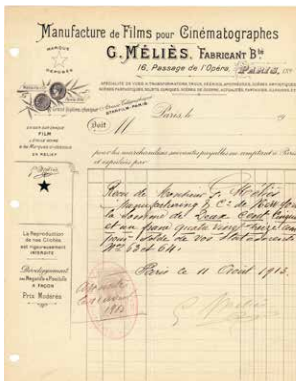
MÉLIÈS (Georges) (1861-1938), Reçu signé. Paris, le 11 août 1913