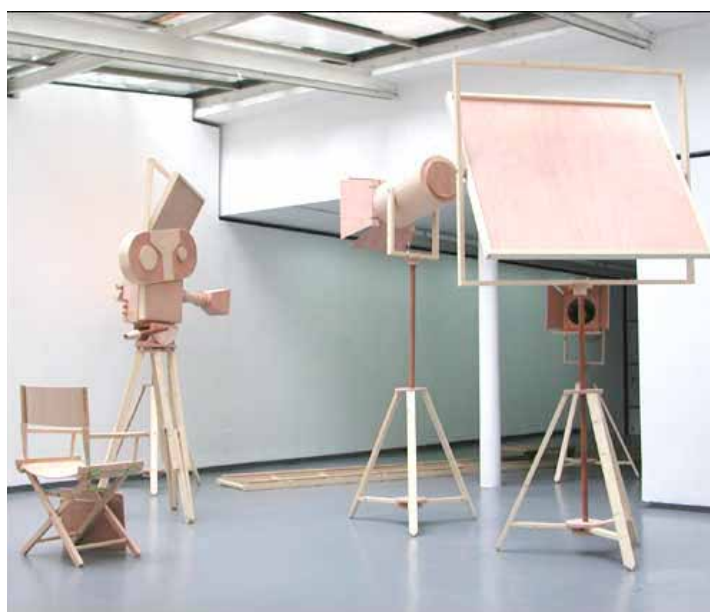
François Nouguiès installation à découvrir à la galerie Frédéric Castaing