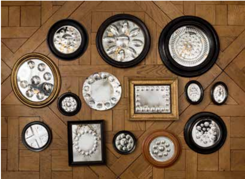
collection de 14 miroirs de sorcière, de 16 à 40 cm, fin XIX e

La galerie Xavier Delesalle est spécialisée en objets d'art et mobilier du XVIII e siècle, elle offre désormais un choix exceptionnel de luminaires de toutes les époques.