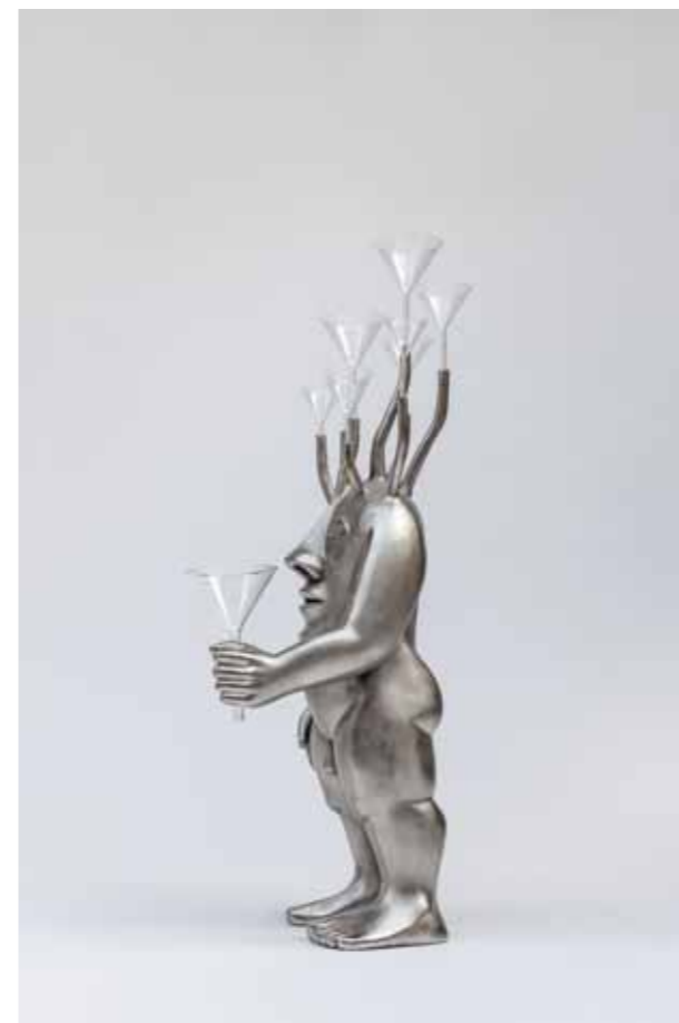
4 Homo Vortex II 2014 Bronze et ambre 50 x 20 x 23 cm