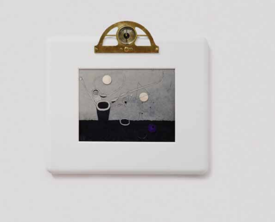
2 Élastogénèse 34 2014 Techniques mixtes, porcelaine organique 44 x 42 x 5 cm