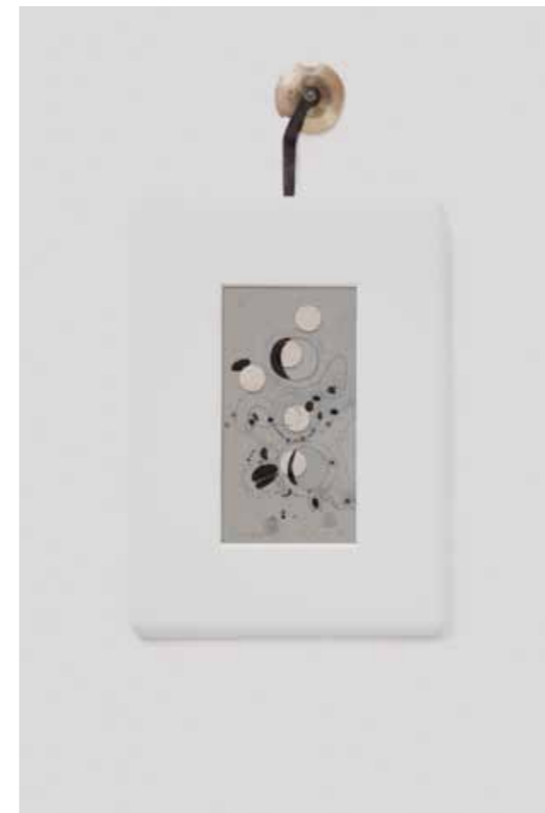
4 Élastogénèse 37 2014 Techniques mixtes, porcelaine organique 100 x 75 x 5 cm