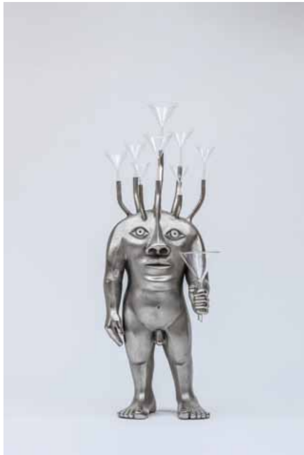
1 Archetype 2014 242 x 86 x 111 cm