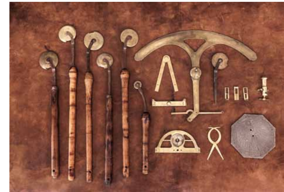
6 Making-of Élastogénèse