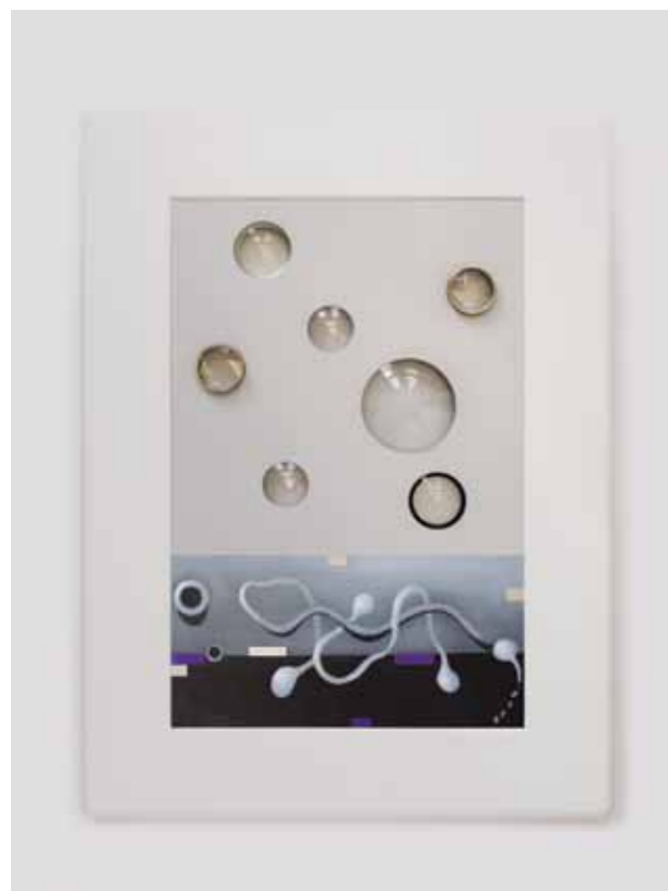
3 Élastogénèse 22 2014 Techniques mixtes, porcelaine organique 60 x 33 x 5 cm