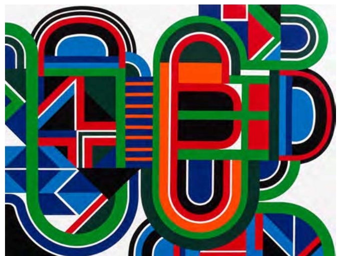
« Delta U Vert »

Laque sur panneau cachet de la signature au dos 50 x 65 cm