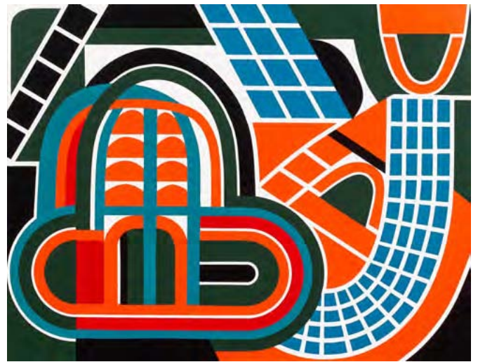
« Studio pôle »

Exposition : 1972, galerie Lefebvre, New-York