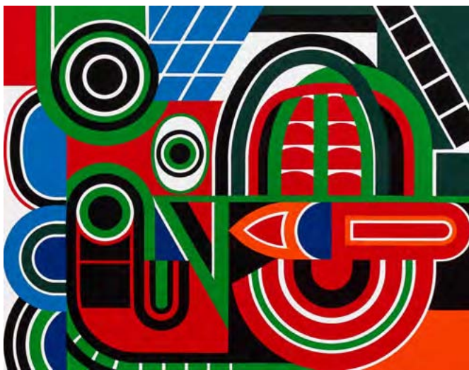
« Dyonisis »

Laque sur panneau cachet de la signature au dos 50 x 65 cm