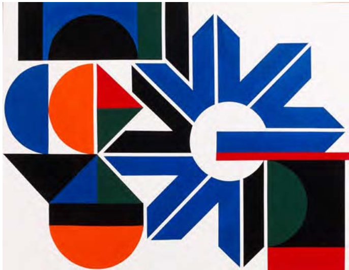
« Magic-Circus » 1972

Laque sur panneau signée et titrée au dos 50 x 65 cm