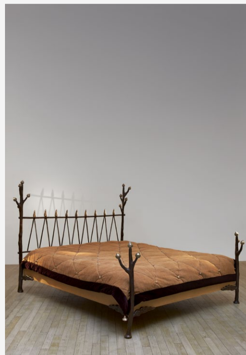
Elizabeth Garouste & Mattia Bonetti Lit « Beaux Rêves », 1990.

Pour contacter Gallery 11 Columbia : vknaebel@11columbia.com +33 6 07 93 68 79 +377 93 25 27 14