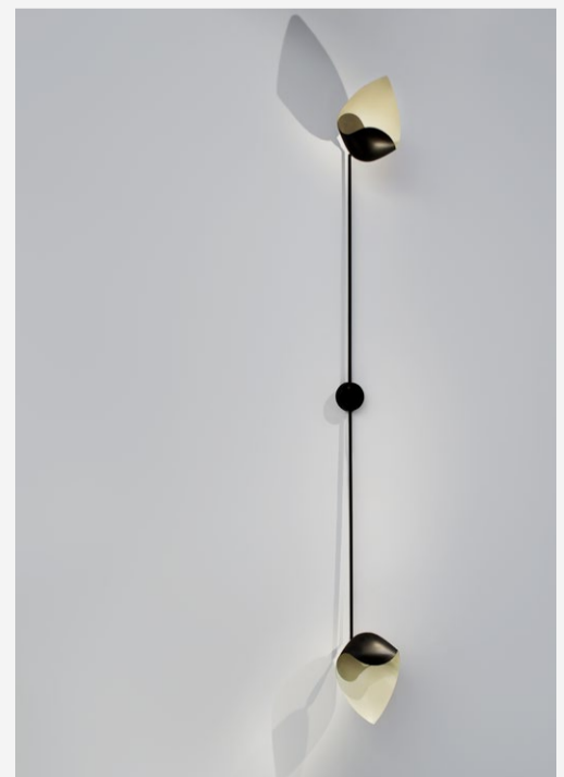
Serge Mouille Applique « Coquille », Ca 1958