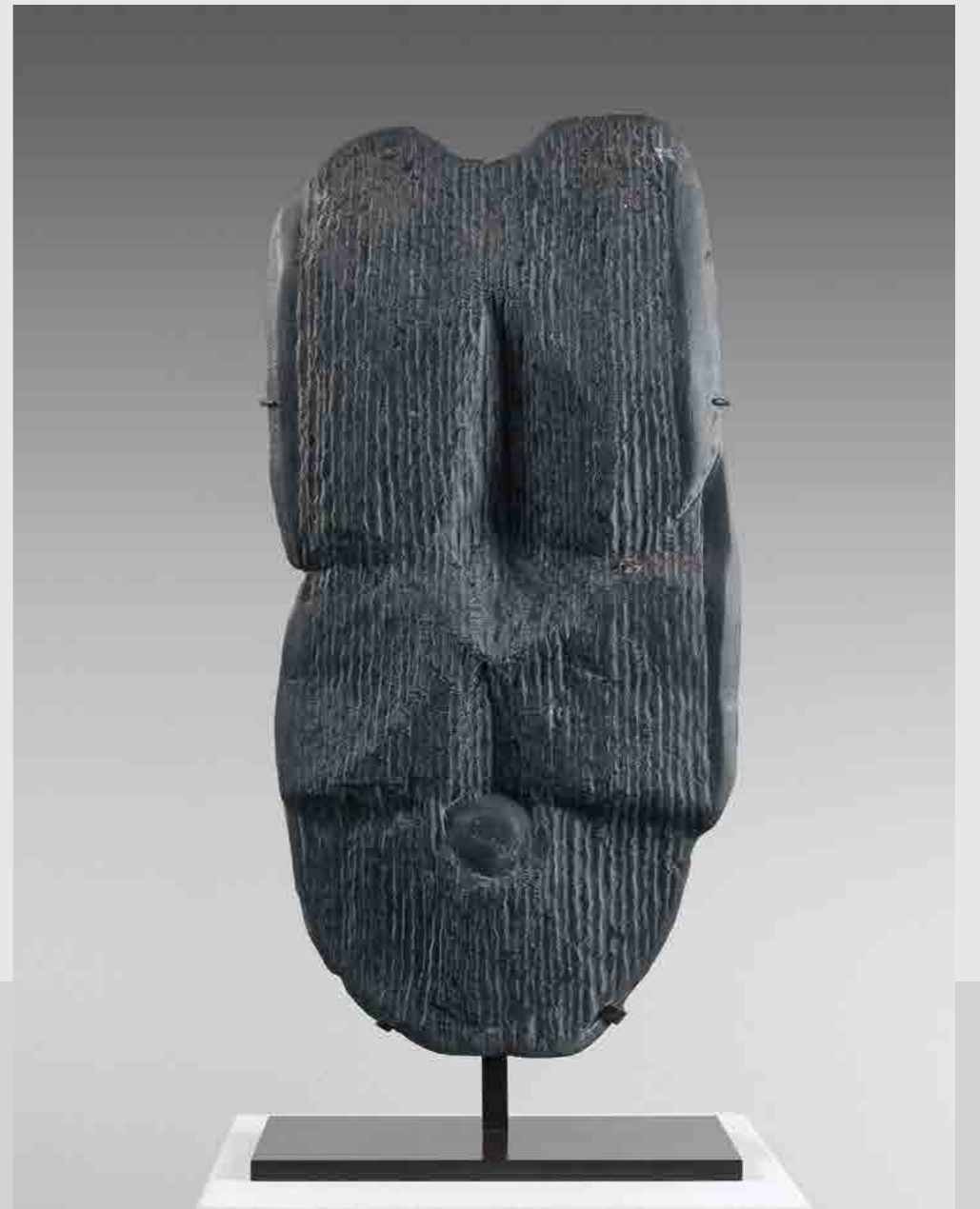
Photographie : Raoul Ubac avec le Petit torse <<<