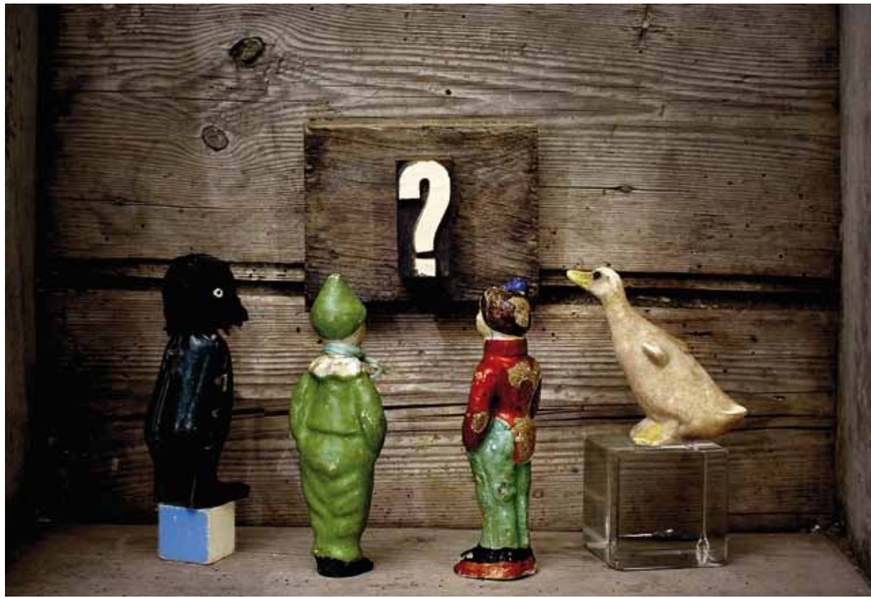
« L'énigme » ; H 74 cm x L 175 cm