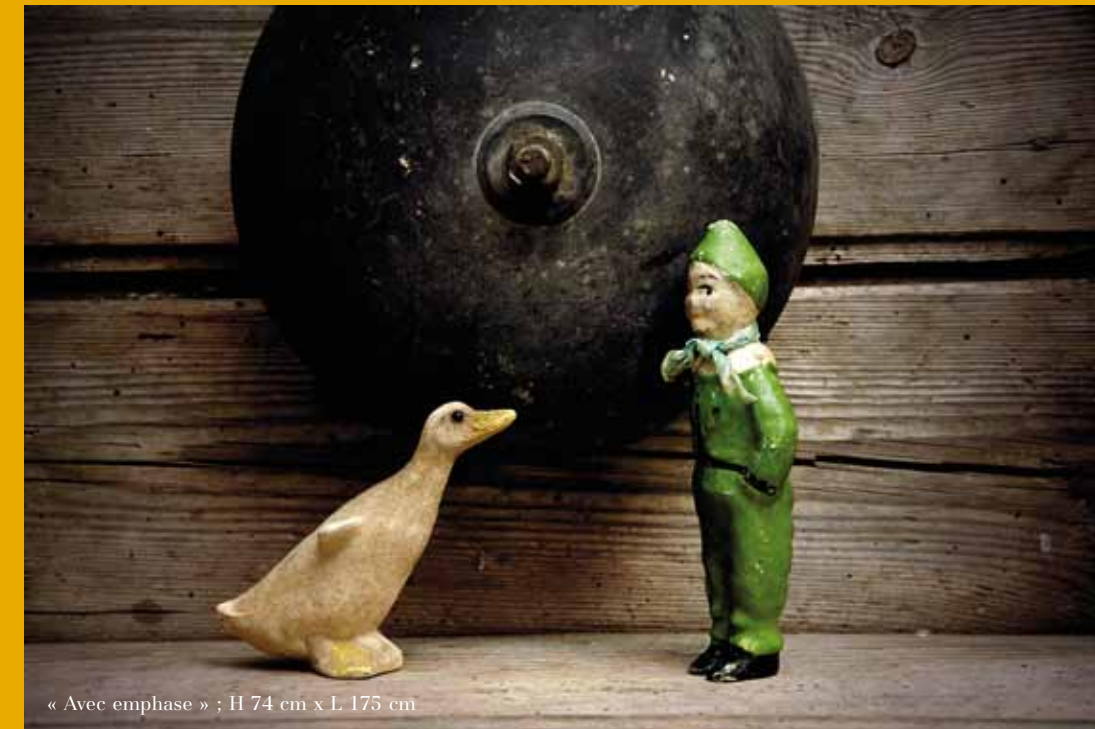
« Avec emphase » ; H 74 cm x L 175 cm

PREMIÈRE PHRASE DU « VOYAGE AU BOUT DE LA NUIT » DE CÉLINE.