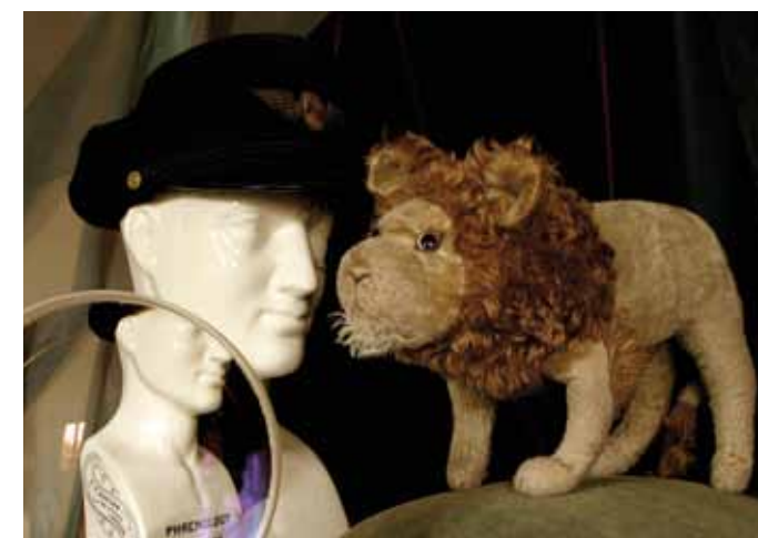
« Saint Jérôme » ; H 74 cm x L 175 cm