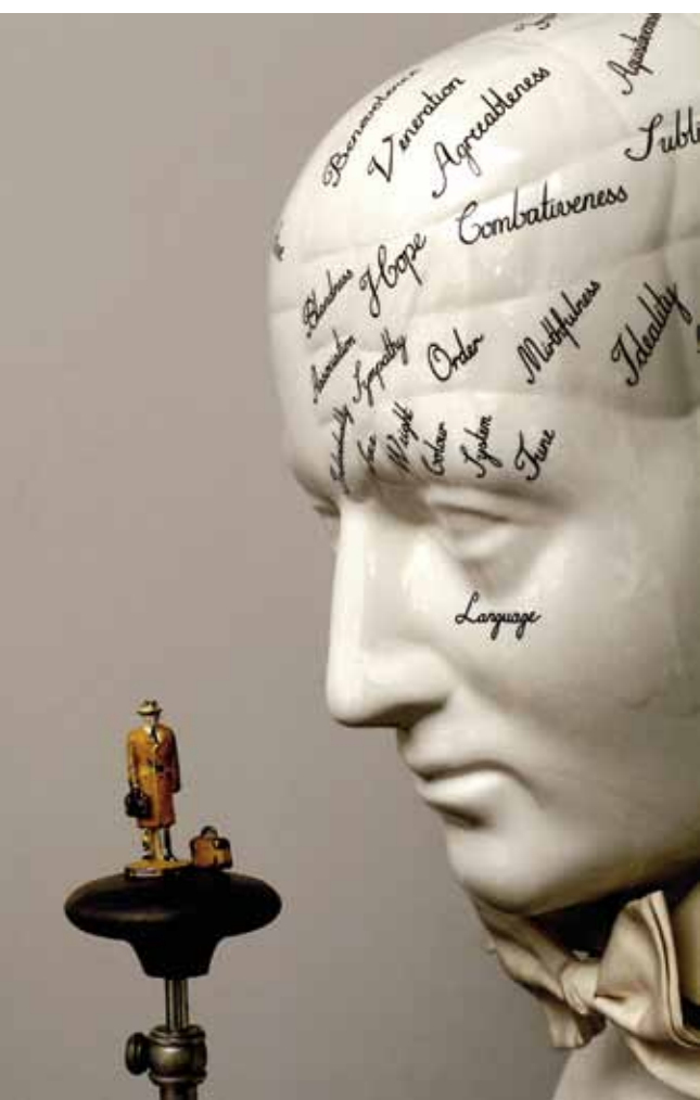
« L'avenir incertain » ; H 175 cm x L 74 cm