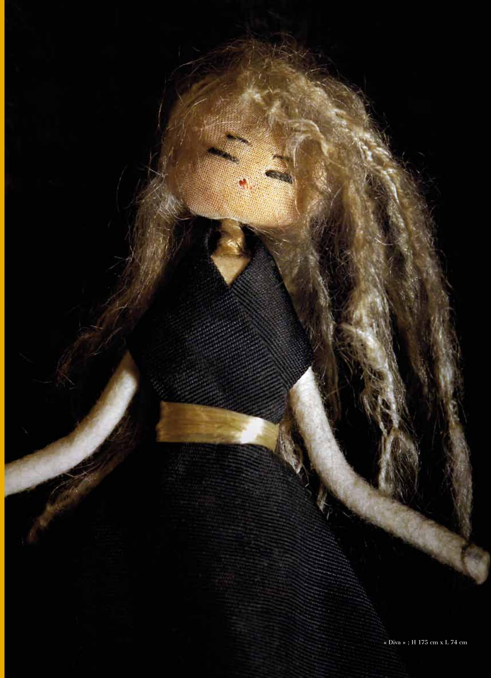
« Diva » ; H 175 cm x L 74 cm