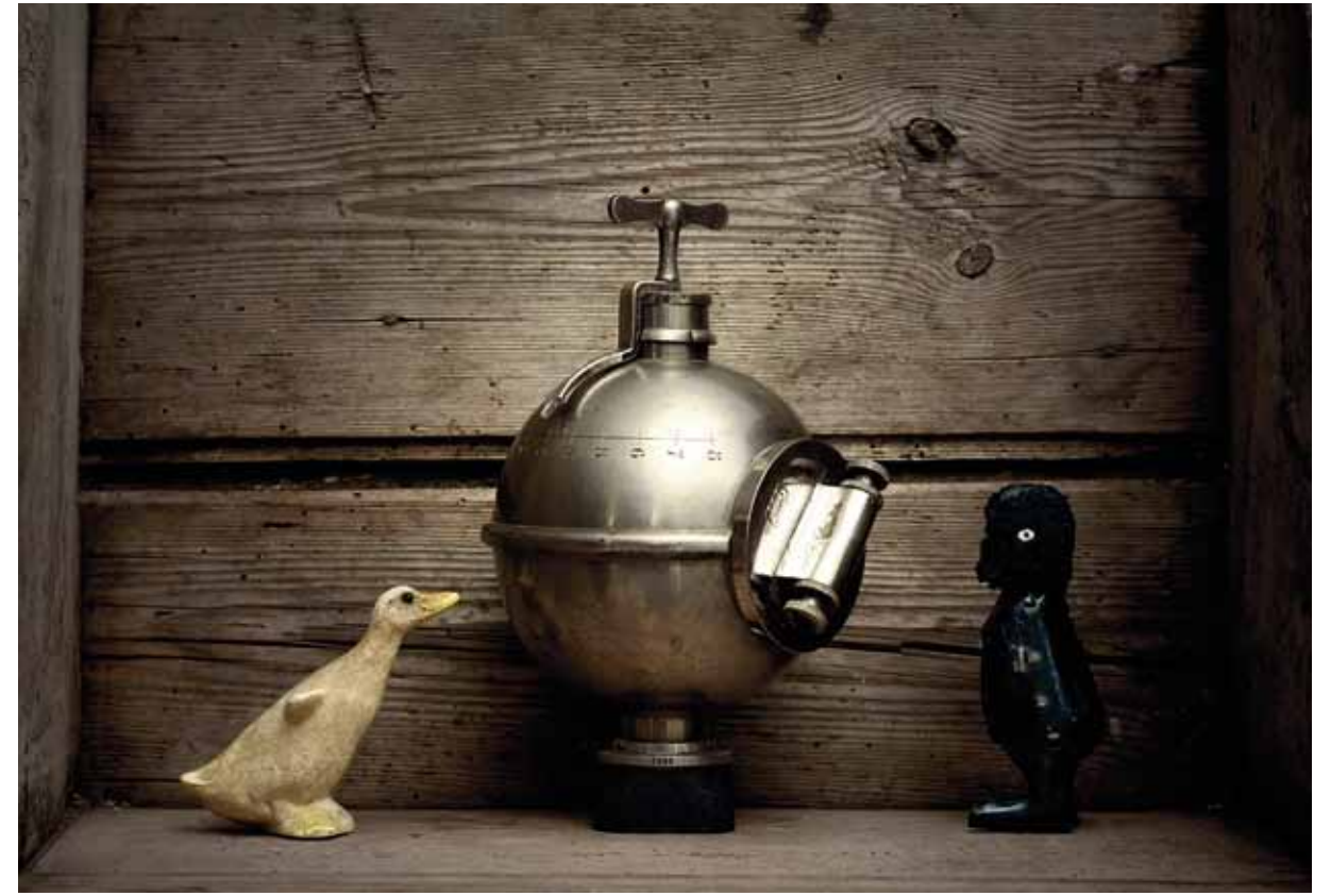
« La macchina » ; H 74 cm x L 175 cm