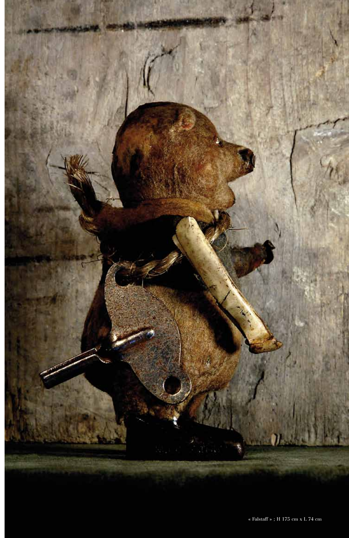
« Falstaff » ; H 175 cm x L 74 cm