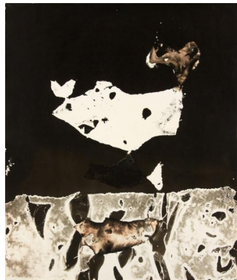
Sans titre , 1950, solarfixe, 60 x 49,5 cm

Solarfixes . Il le considèrera par la suite comme étant le plus abouti. Les visiteurs pourront admirer des œuvres rares, réalisées sans appareil photo ni chambre noire. Chaque Solarfixe est une épreuve unique, c'est ce qui rend ce travail si authentique et le distingue de celui d'artistes tels que Man Ray qui rephotographiait ses photogrammes. Ses seuls outils de création sont la lumière et du papier sensible. Avec cette technique, il réussit à déconstruire la photographie traditionnelle ; seule la lumière étant à l'origine des formes visibles de ses images. Il a su faire naître des figures de l'abstraction elles-mêmes.