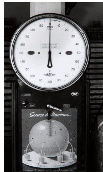
Masques , env. 1960, tirage gélatino-argentique d'époque, 25,5 x 15 cm