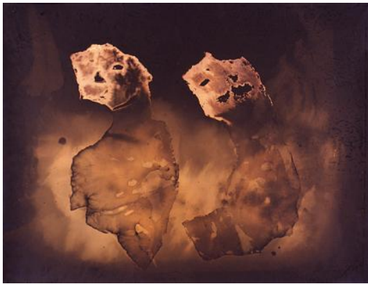
Sans titre , env. 1950, solarfixe, 49,8 x 64,6 cm

L'hommage à Théodore Brauner se poursuit à la galerie Alain Le Gaillard, opportunité de découvrir plus d'une quarantaine d'œuvres exceptionnelles du photographe extraites de la série des Solarfixes .