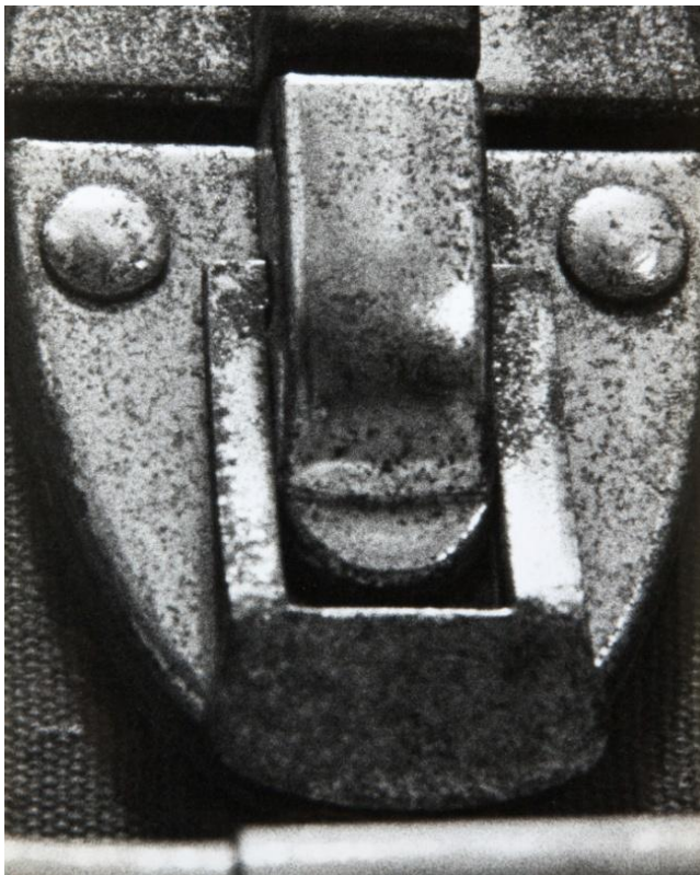
Masques , env. 1960, tirage gélatino-argentique d'époque, 30 x 24 cm