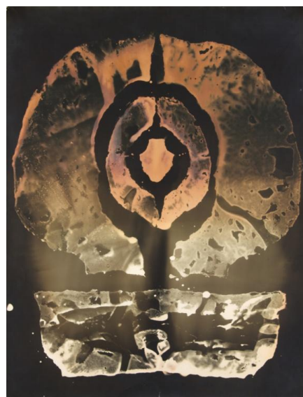
Sans titre , environ 1950, solarfixe, 64,5 x 50 cm

« J'exposais d'abord mon papier sensible en plein soleil. En pleine contradiction avec toutes les techniques connues et offertes à tous. Je me trouvais, moi, en dehors des lois, libre et autonome. Je m'imposais mes règles. »