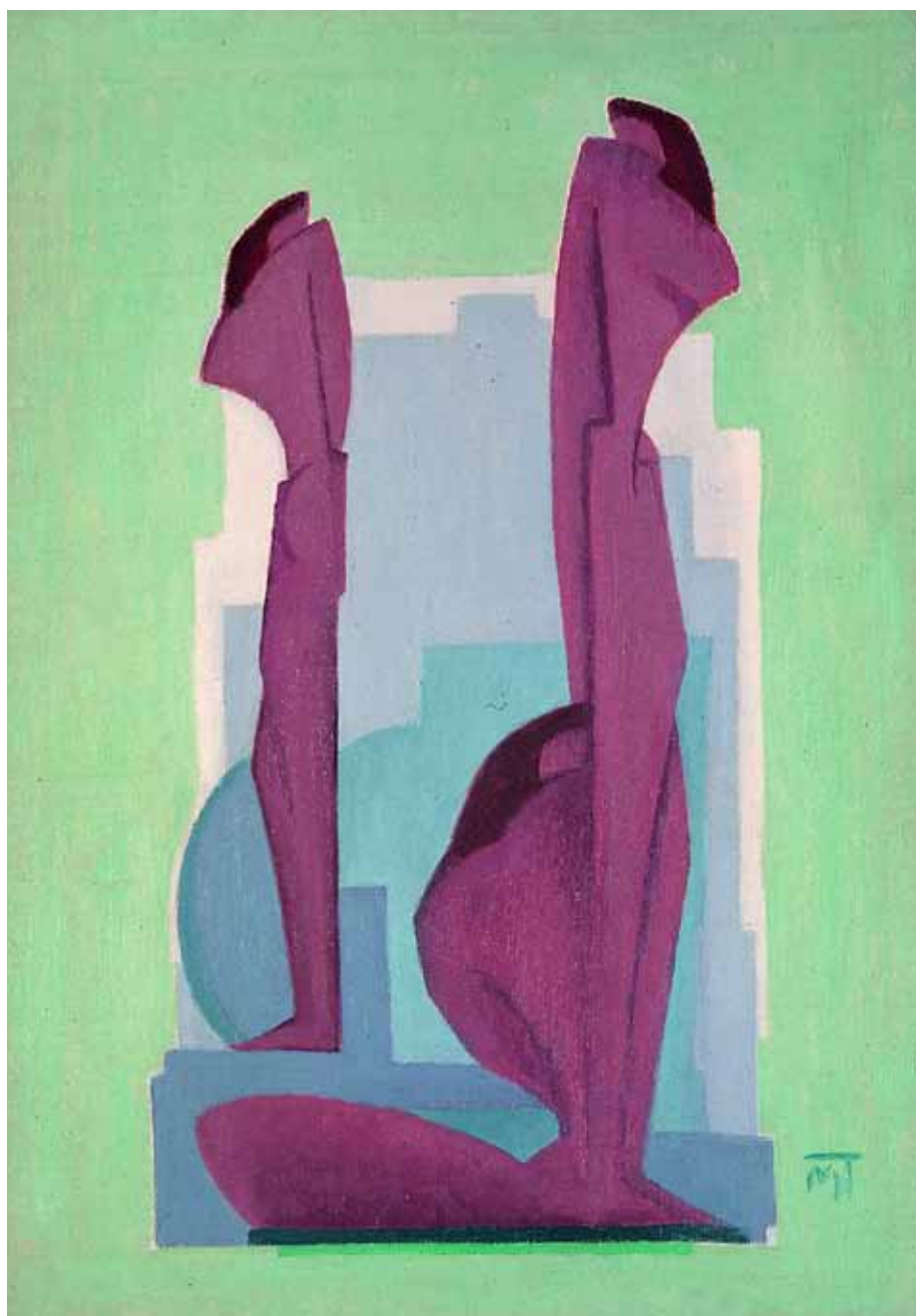
Trois figures (F141), 1927 Huile sur toile, 64x45 cm

Après la deuxième guerre mondiale, il vécut en Roumanie et tomba dans l'oubli, isolé du monde par le bloc communiste.