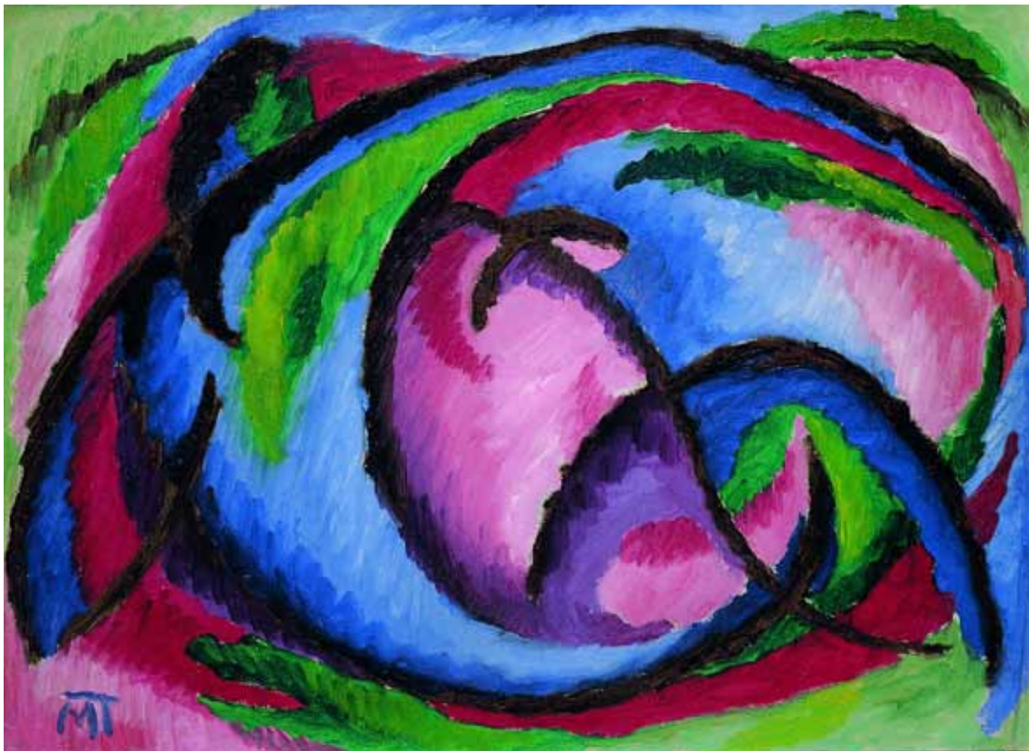
Composition (Sens), (F70.), 1920 Huile sur carton, 29x39 cm

Au cœur de cette période, prédominent les « Sens », un jeu de couleurs intenses, des formes archées, et les rythmes colorés prennent le dessus sur la figure.