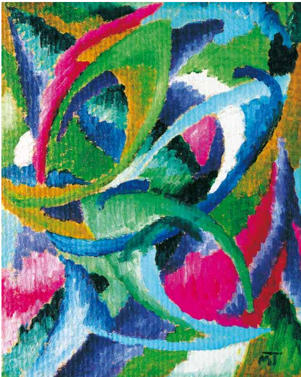
Composition (Sens), vers 1920 (F 69.) Huile sur carton, 36 x 28,9 cm