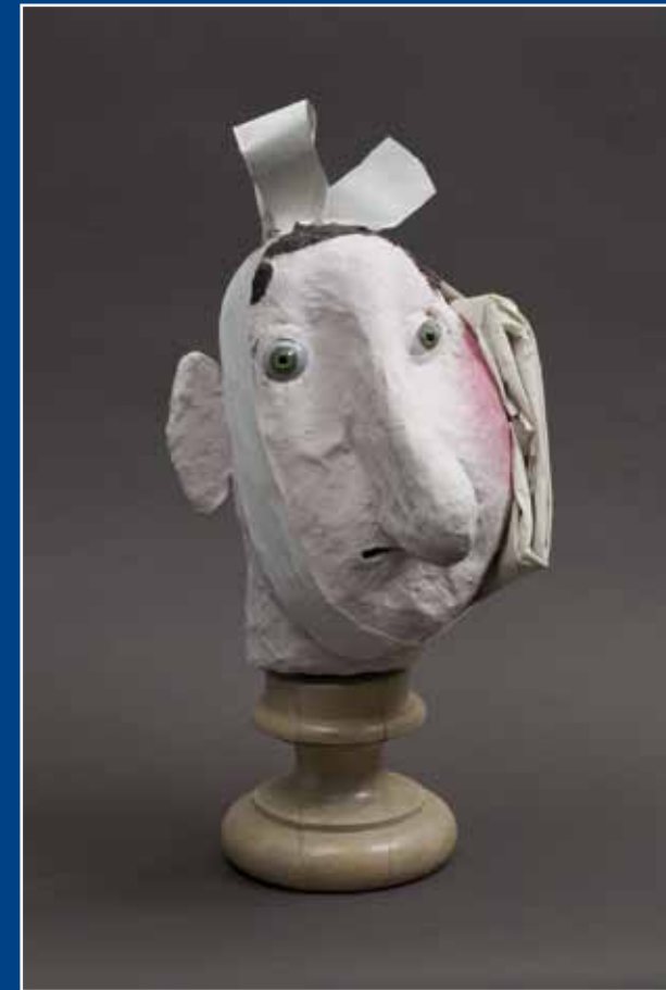
Réchauffement de la planète (page de gauche) / 2007 / Sculpture en papier mâché / Pièce unique / H.72 x L.23 x P.17 cm En joue : feu (ci-dessus) / 2009 / Sculpture en papier mâché / Pièce unique / H. 43 x L. 18 x P. 24 cm