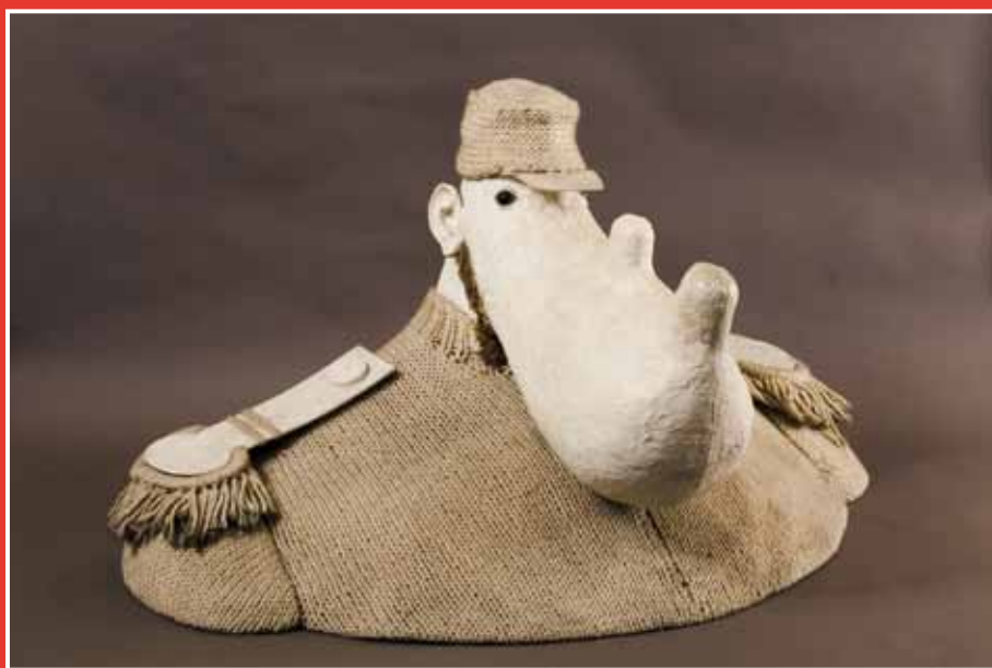
Le caporal Tricotet (ci-dessus) / 1972 / Sculpture en papier mâché, laine et acrylique / Pièce unique / H.60 x L.110 x P.60 cm Garde (page de droite) / 1994 - 2008 / Sculpture en résine Haligon / Pièce unique / H. 62 x L. 19 x P. 20 cm