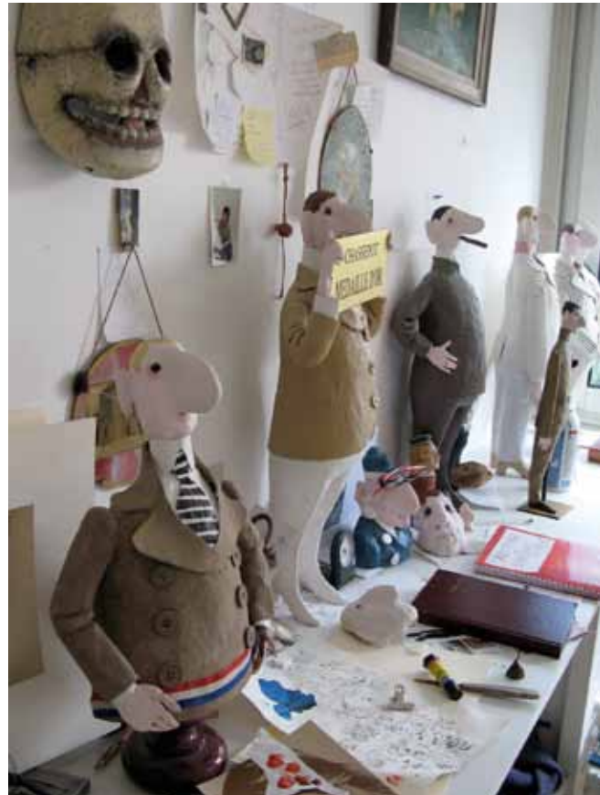
Vues de l'atelier de Chasse-Pot.

La galerie Vallois sculptures consacrera un one man show à Chasse-Pot du 1 er décembre 2011 au 28 janvier 2012 autour d'une vingtaine d'œuvres. Dans son abécédaire, à la lettre R, comme rétrospective, il déclarait : « En général, on en organise pour les artistes morts, j'espère que ce n'est pas un mauvais présage » ... Jean-Jules Chasse-Pot (1933-2010).