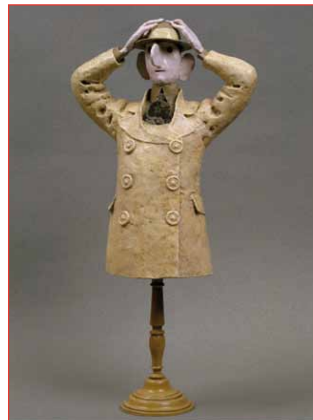
Façon poupée russe (page de gauche) / 2002 / Sculpture en papier mâché / Pièce unique / H. 91 x L. 34 x P. 36 cm Se prendre la tête (ci-dessus) / 2005 / Sculpture en bronze / Fonderie Rosini, n°EA 2/4 / H. 53 cm