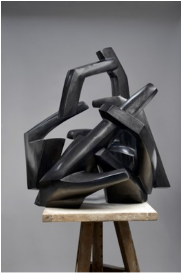
«La Grotte aux Doigts»