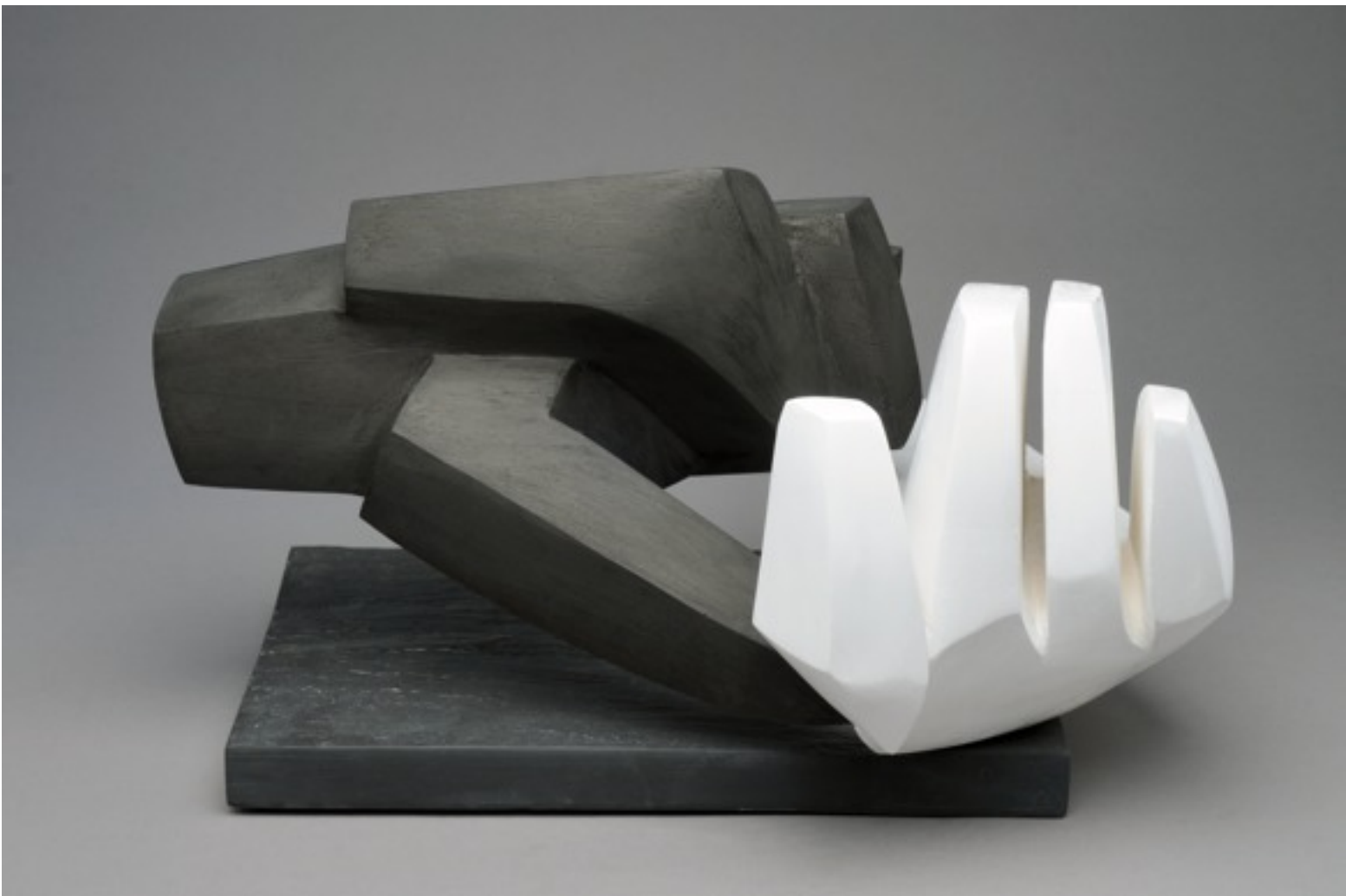
«La Poignées de mains»