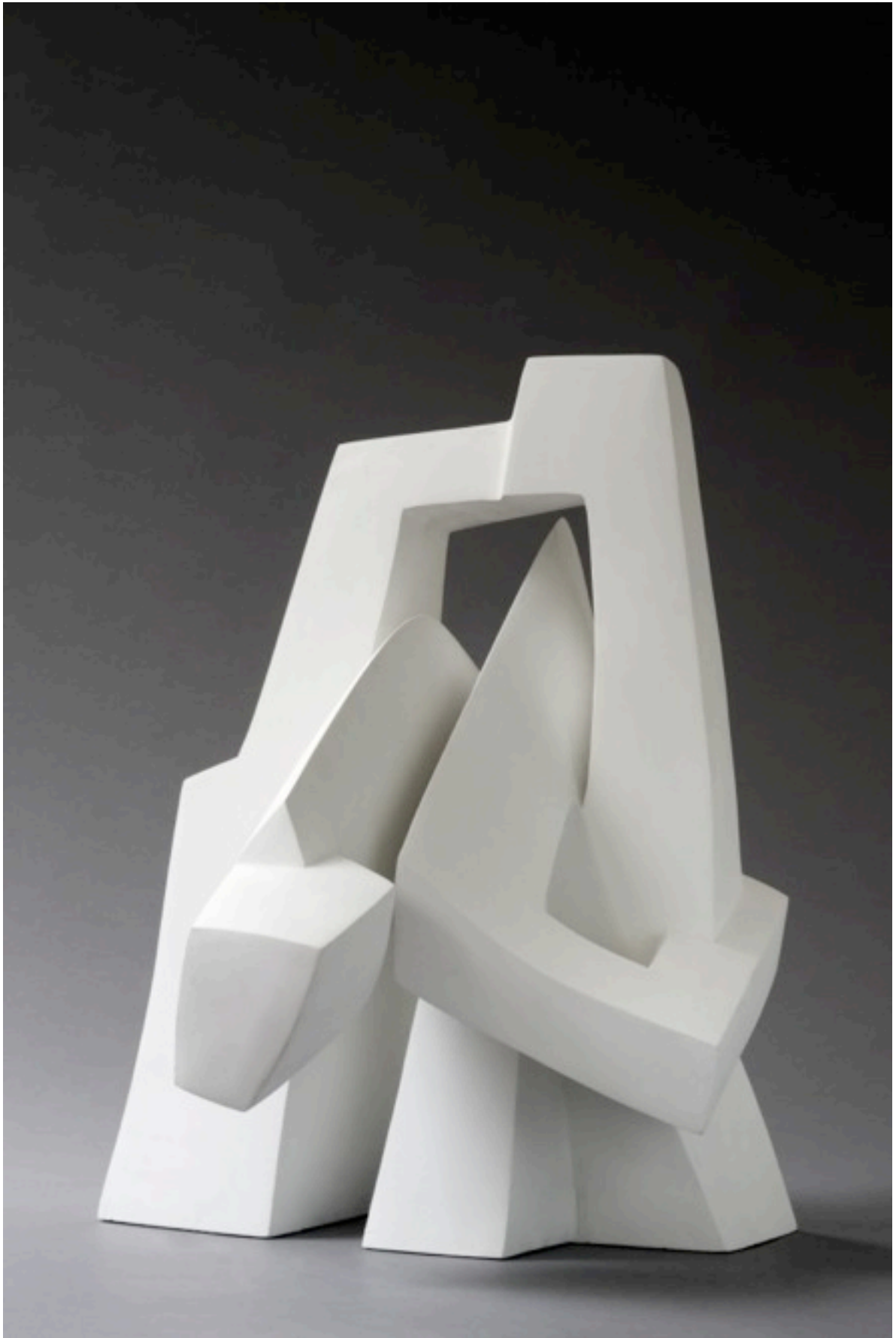
«Personnage au Portique»